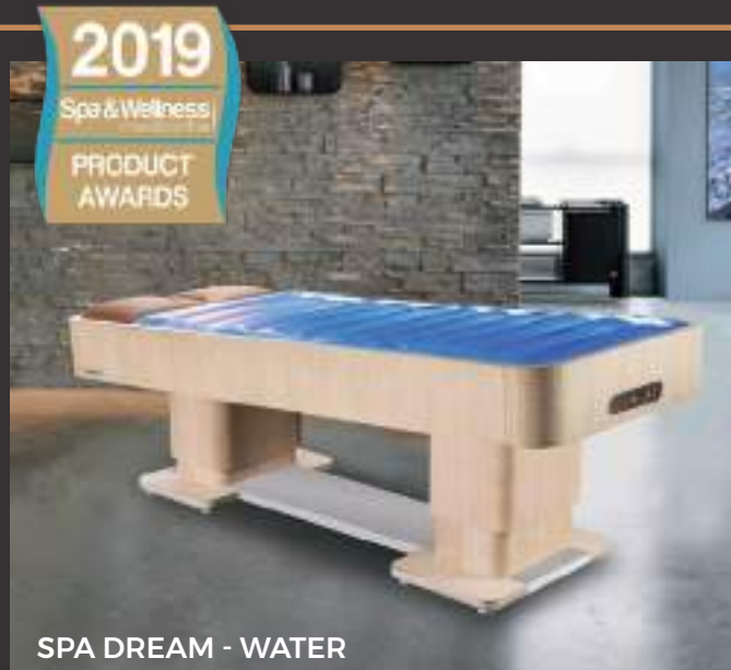
SPA DREAM - WATER