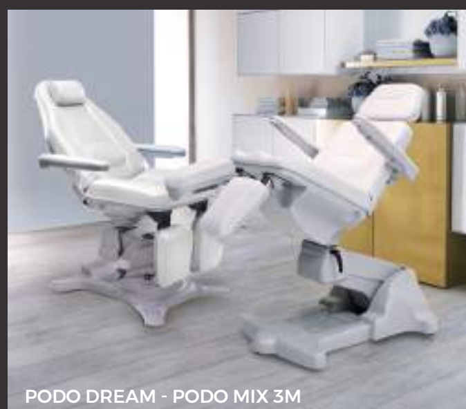
PODO DREAM - PODO MIX 3M