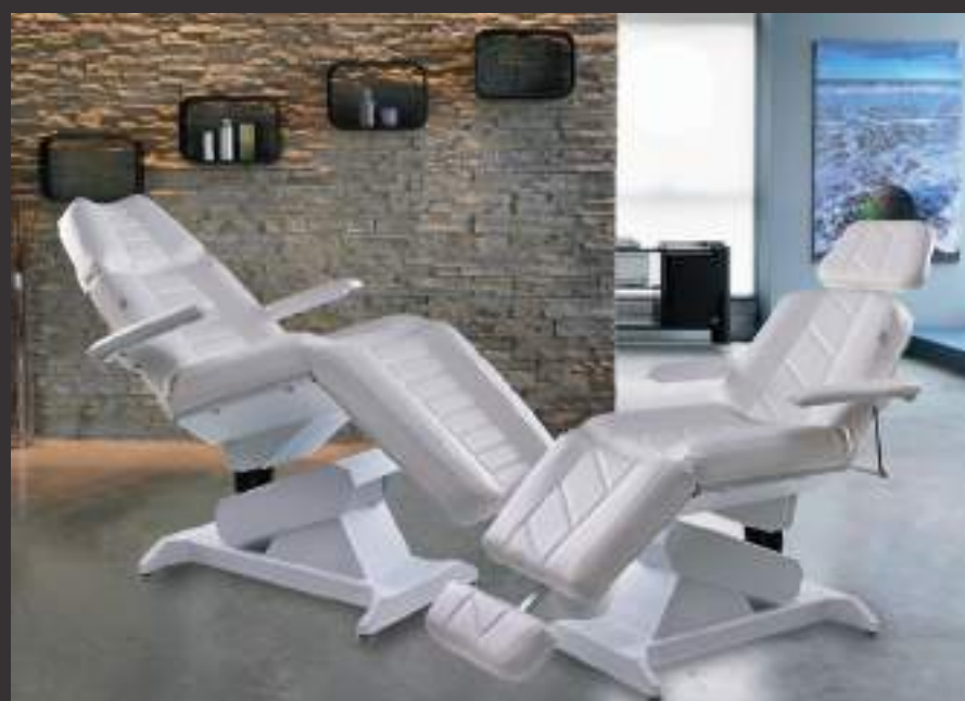
LEMI 4 - LEMI 4 BI-ZAK