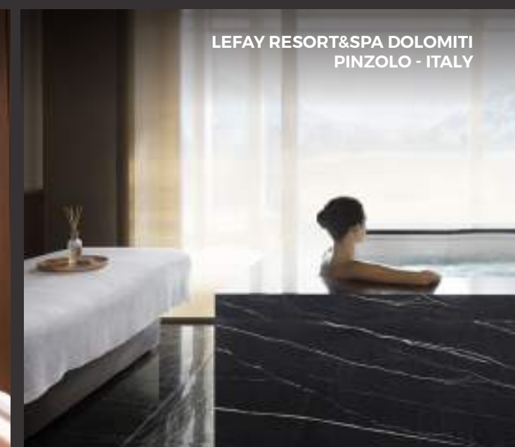
LEFAY RESORT&SPA DOLOMITI PINZOLO - ITALY