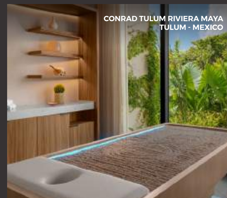
CONRAD TULUM RIVIERA MAYA TULUM - MEXICO