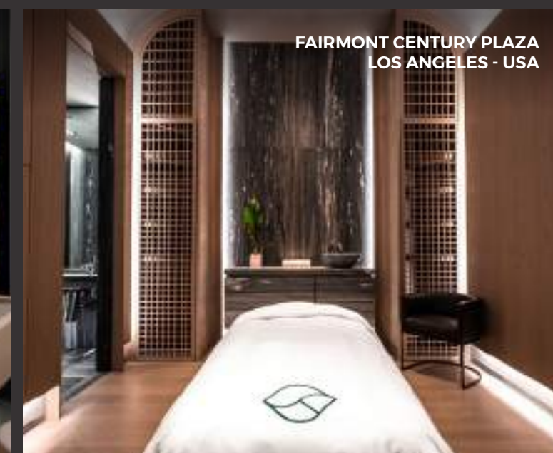
FAIRMONT CENTURY PLAZA LOS ANGELES - USA