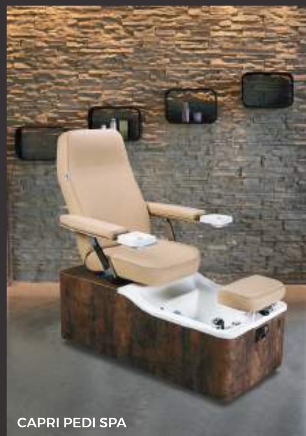
CAPRI PEDI SPA

Dall'idea al progetto, dal prototipo all'imballo, l'intero ciclo di vita dei prodotti viene gestito internamente e ogni singolo pezzo valutato secondo severi criteri di controllo. Perché i nostri clienti meritano solo la perfezione.