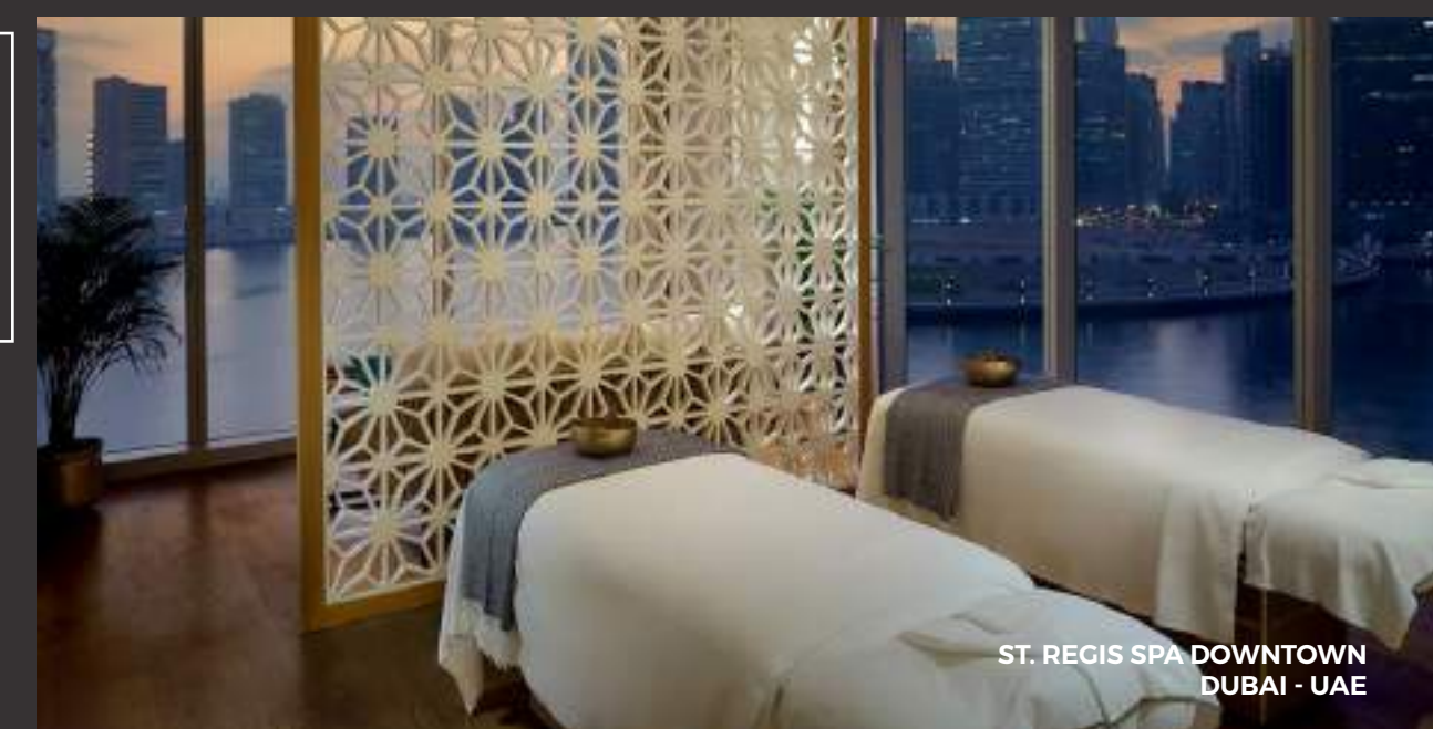
ST. REGIS SPA DOWNTOWN DUBAI - UAE

ORGOGLIOSO PARTNER DELLE MIGLIORI SPA DEL MONDO