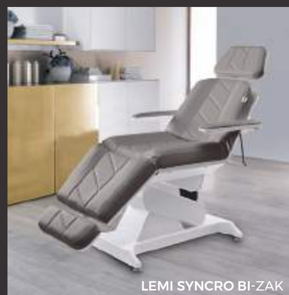
LEMI SYNCRO BI-ZAK